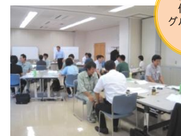
新人への伝え方をグループ内で実践