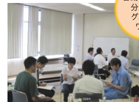
言動特性別に分かれたグループワーク

新人とのコミュニケーション(言動特性) 分かりやすいアドバイス 的確に注意するコツ 仕事の把握 指導のステップ(やる気を引き出す) 教えた後のフォローの仕方