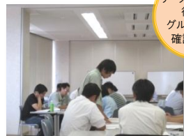
リーダーとしての役割をグループ内で確認し発表

自分の新人時代を振り返る(事前課題より) OJTリーダーの役割とは リーダーシップとOJTのメリット 指導内容(具体的業務・基本的行動)について 新人育成担当者にもとめられること 新人からの質問されたときの答え方