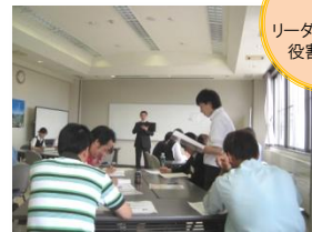
事前課題 発表 リーダーとしての 役割を確認

自分の新人時代を振り返る(事前課題より) OJTリーダーの役割とは リーダーシップとOJTのメリット 指導内容(具体的業務・基本的行動)について 新人育成担当者にもとめられること 新人からの質問されたときの答え方