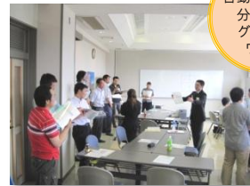
言動特性別に 分かれた グループ ワーク

新人とのコミュニケーション(言動特性) 分かりやすいアドバイス 的確に注意するコツ 仕事の把握 指導のステップ(やる気を引き出す) 教えた後のフォローの仕方