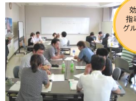
効果的な 指導方法を グループ内で 共有