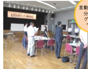
言動特性別に 分かれた グループ ワーク

新人とのコミュニケーション(言動特性) 分かりやすいアドバイス 的確に注意するコツ 仕事の把握 指導のステップ(やる気を引き出す) 教えた後のフォローの仕方