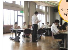
事前課題 発表 リーダーとしての 役割を確認

自分の新人時代を振り返る(事前課題より) OJTリーダーの役割とは リーダーシップとOJTのメリット 指導内容(具体的業務・基本的行動)について 新人育成担当者にもとめられること 新人からの質問されたときの答え方