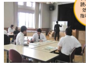
事例研究から 読み取れる 効果的な 指導方法を 共有